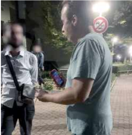
Photo nuits 4 au 6 septembre 2020 (Conseillé municipal de Drancy sans masque)

Le Président donne la parole à 14h15, à la CGT, En liminaire, la CGT rappelle l'obligation d'avoir les documents préparatoires 8 jours avant ce qui n'a pas été le cas pour une de nos mandatés CHSCT. Nous rappelons que c'est au domicile, avec le moins de contact physique que nous devons avoir les documents. Nous précisons que la diffusion numérique de premier protocole ne répond pas à une lecture pour l'ensemble des 2000 agents Ville et CCAS. Il y a du travail ! Vu le non respect du port du masque et des gestes barrières pour exemple d'une élue CHSCT présente à la séance et ne portant pas le masque alors que par 4 fois le DRH vient d'en emmètre l'obligation. C'est certain, c'est dans les lieux de travail que notre résultat est mauvais.